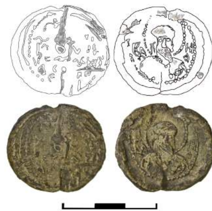
Рис. 5. Печать Владимира Всеволодовича Мономаха (прорисовка и фотография)

Вес 0,65 г, размер 17,2 x 9,6 мм. Предполагаемый диаметр 19-21 мм.