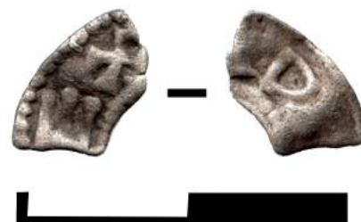
Рис. 7. Фрагмент денария Оттона III