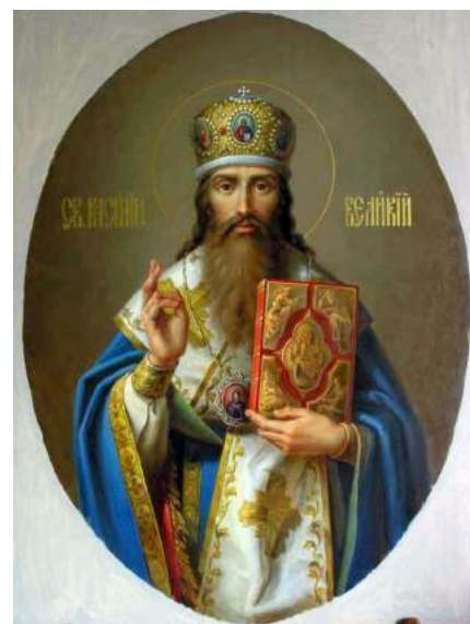
Рис. 6. Изображение Свт. Василия Великого на современной иконе