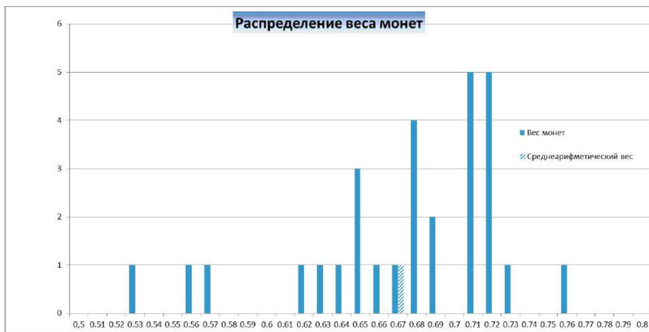
Fig. 5. Distribution of the coins weights struck at Haydar-Bazari.

When compiling this diagram, the authors used all the information on the weight characteristic of dangs that they had not being however sure of the absolute accuracy of measurements not performed by them. As a result the average arithmetic weight of the coin was 0.67 g.