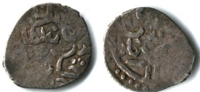
Fig. 3. Dang of Khan Bek-Sufi. 0.91 g.

Fig. 3 shows a photograph of the Crimean dang of Khan Bek-Sufi (the obverse of which was drawn and read by A. L. Ponomarev 1 ) with بيك close to the name of the Khan.