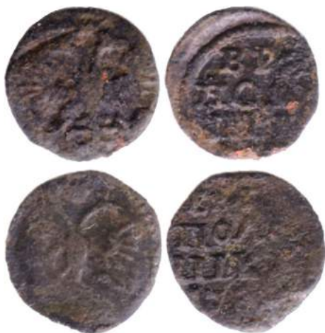
Рис. 3. Полушки, 1718–1722 рр. (?), мідь. Московська держава, Петро I Олексійович (1696-1725), зображення збільшено.