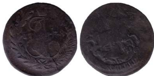
Рис. 9. Две копійки, 17(?)8 р., мідь. Російська імперія, Катерина II (1762–1796), зображення збільшено.