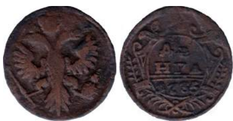
Рис. 5. Денга, 1735 р., мідь. Російська імперія, Анна Іоанівна (1730–1740), зображення збільшено.