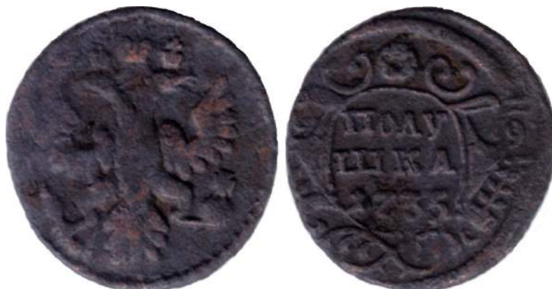
Рис. 4. Полушка, 1735 р., мідь. Російська імперія, Анна Іоанівна (1730–1740), перекарбування з “хрестової” копійки 1729 р. (зображення збільшено).