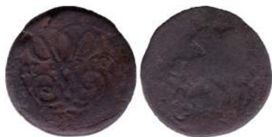
Рис. 7. Денга, 1760 р., мідь. Російська імперія, Єлизавета Петрівна (1741–1761), зображення збільшено.