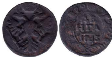
Рис. 6. Денга, 1743 р., мідь. Російська імперія, Єлизавета Петрівна (1741–1761), зображення збільшено.