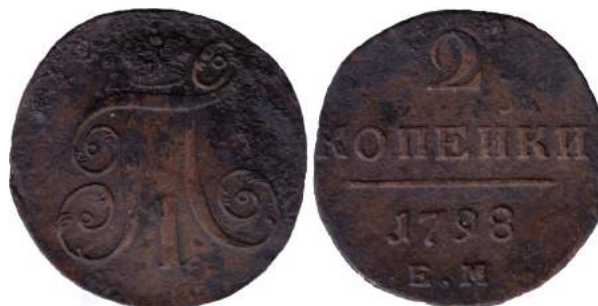
Рис. 10. 2 копійки, 1798 р., мідь. Російська імперія, Павло I (1796–1801), зображення збільшено.