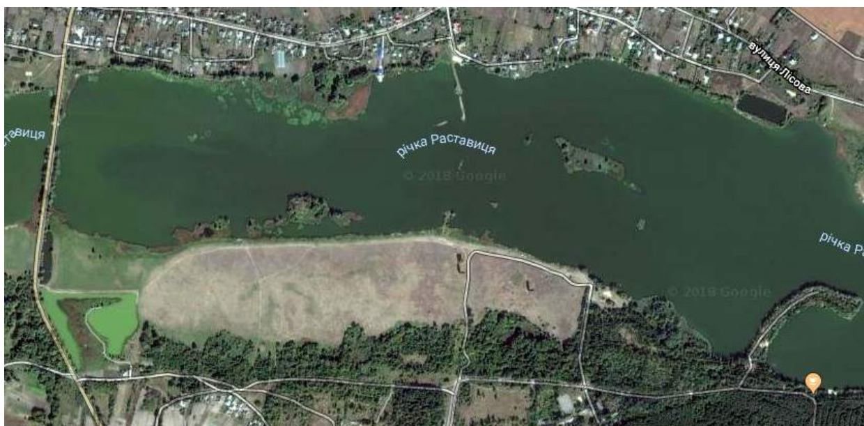
Рис. 1. Локалізація місця нумізматичного польового дослідження (показане стрілками), с. Трушки Білоцерківського району Київської області. Фрагмент супутникової мапи Google, 2018 р.